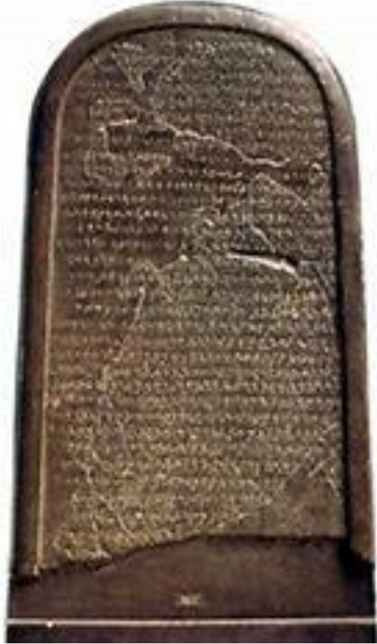
المسلة المؤابية للملك ميشع